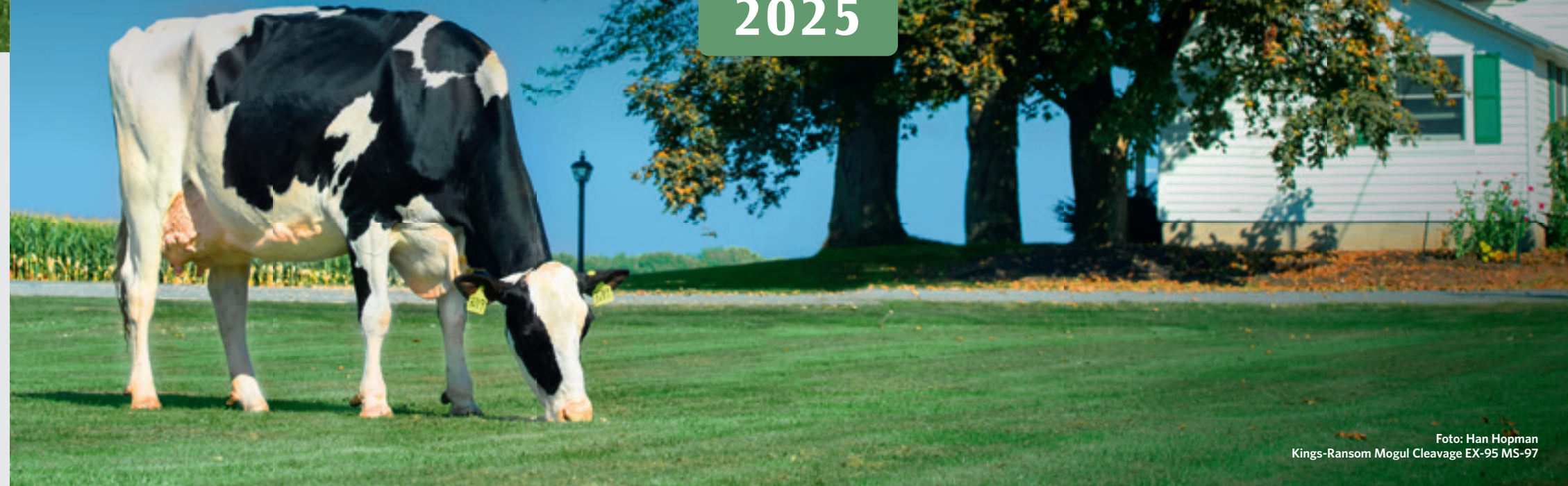
Kings-Ransom Mogul Cleavage EX-95 MS-97